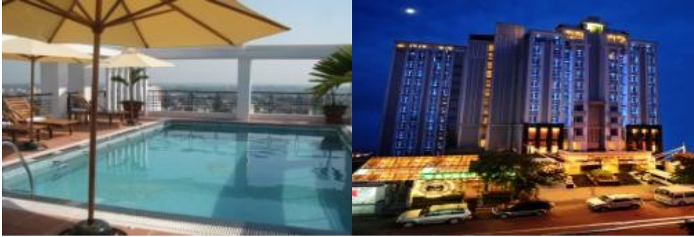
HOI AN: Thuy Duong 3* www.thuyduonghotel-hoian.com