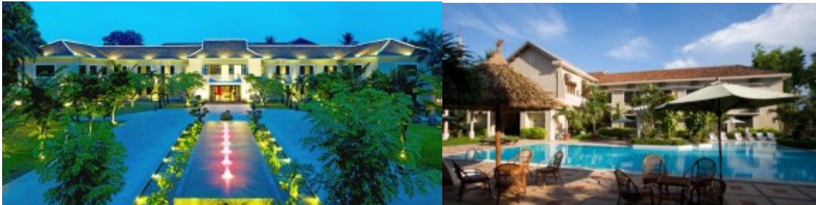
SAIGON : Sunflower Central 3* http://www.sunflowerhotel.vn/sunflower-central-hotel/deluxe.php