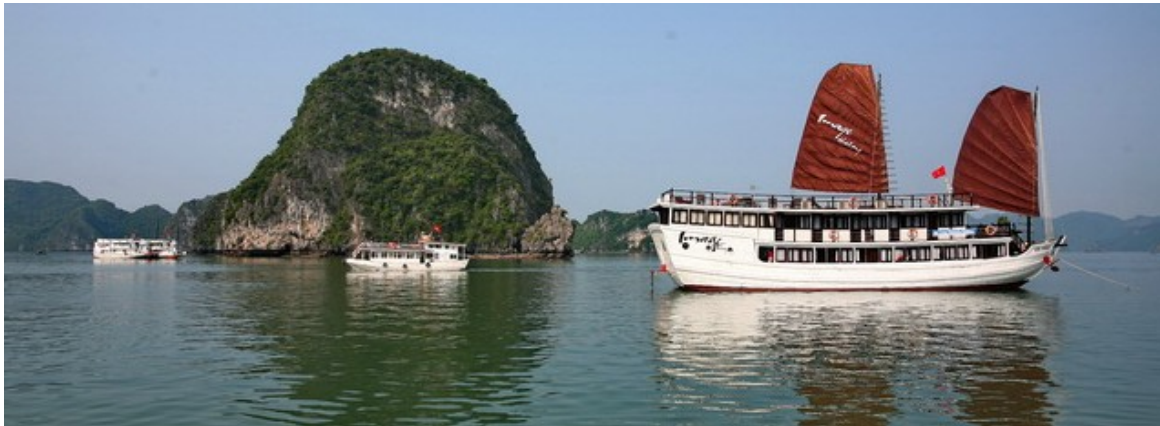
HALONG : Jonque Pelican 4* http://imagehalongcruise.com