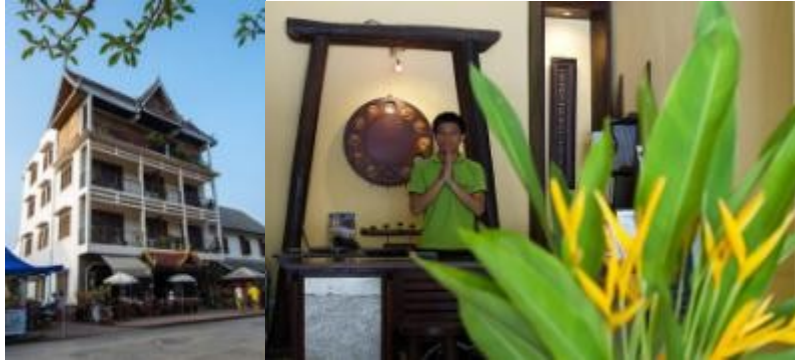
LUANG PRABANG : Villa Santi Resort www.villasantihotel.com