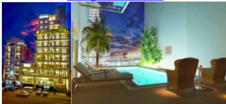
HUE : Romance 4* www.romancehotel.com.vn